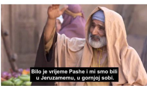
YouTube - Silazak Duha Svetoga