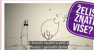
Mali katekizam – Tko je bio Isus?