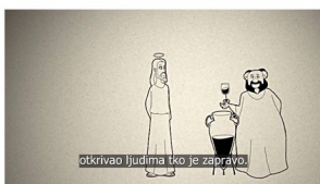
Mali katekizam – Kako je Isus živio?