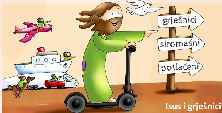
Isus i grješnici

Po Isusovim riječima i djelima govorio je i činio sâm Bog – Bog koji ljubi i prihvaća, koji se očituje malenima, slabima, nemoćnima, djeci.