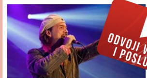
Gibonni - Kakav prijatelj je Isus